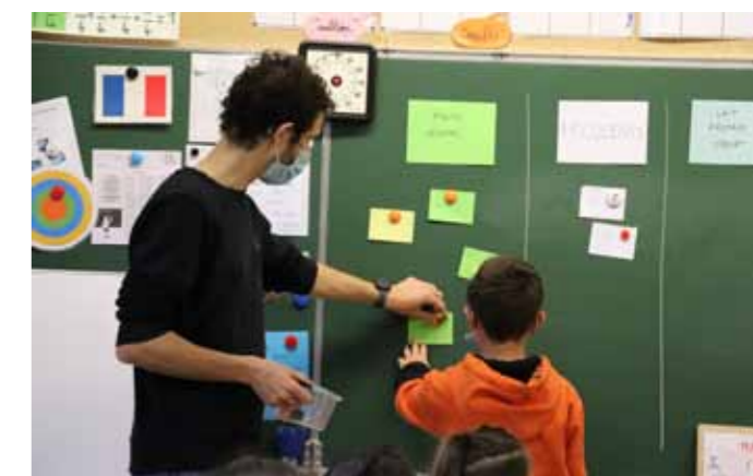
Animation en classe de la ferme à l'assiette - Classe de CM2 Ecole de St-Herblain - février 2022