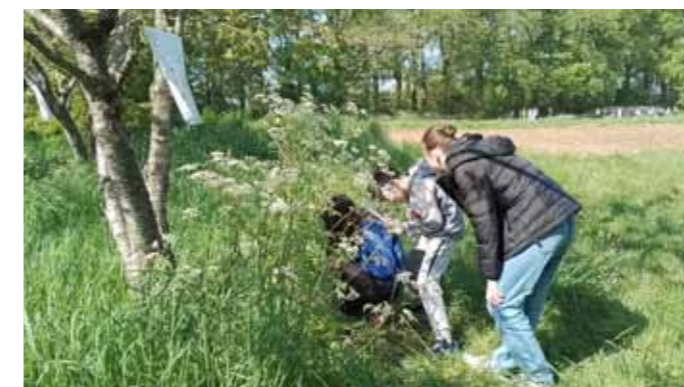
Visite de ferme Les rangs d'oignons (Le Cellier) avec 2 classes de 6e du collège La Perverie de Nantes - Mars 2022