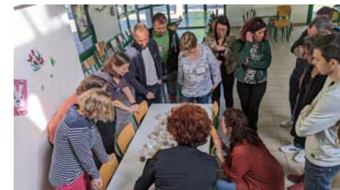
Sensibilisation d'élus, parents d'élèves sur la cantine scolaire nourricière, bio et locale - Ples-sé - avril 2022