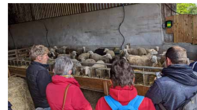
Animations « les produits laitiers bio locaux » sur 3 restaurants d'entreprise Orange - avec la présence de la ferme des 3 chênes - mai 2022