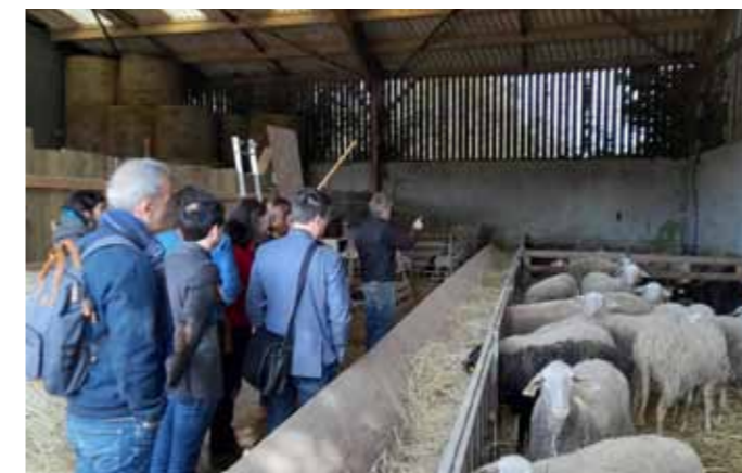
Journée de Clôture du défi Collèges à Alimentation Positive à la Ferme de la Joue et à la Bergerie de la Joue (Vigneux de Bretagne) - Public concerné : 5 collèges représentés - 14 personnes (chefs de cuisine, gestionnaires, enseignants) - avril 2022

Retrouvez ci-dessous un retour en photos sur quelques actions réalisées en 2022