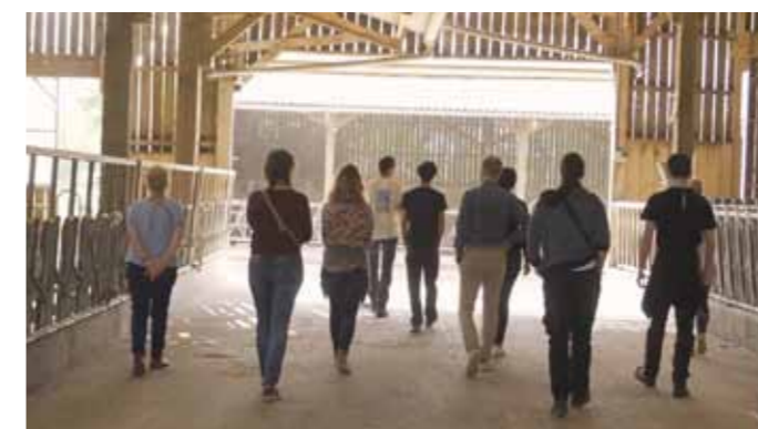
Cycle d'ateliers avec les associations sportives nantaises sur « Comment penser une alimentation plus durable au sein d'un club (buvettes, ravitaillements...) ? » Ferme des 9 journaux à Bouguenais - mai 2022